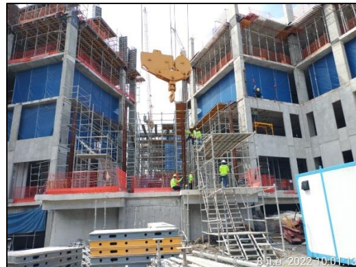
ภาพที่ 1.6-1 สถานภาพการก่อสร้างโครงการในปัจจุบัน